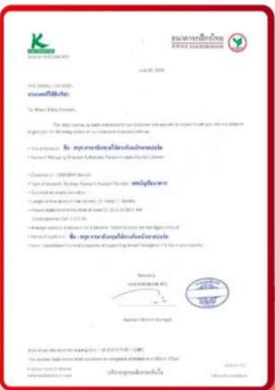
ตัวอย่าง Bank Guarantee ที่ผู้สมัครต้องยื่นกับธนาคาร