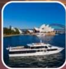
ล่องเรือชมอ่าวซิดนีย์