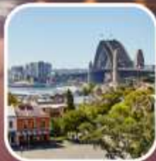
SYDNEY OBSERVATORY HILL