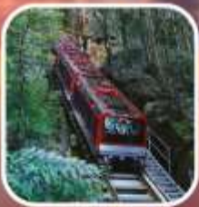
อุทยานบลูเมาท์เท็นส์