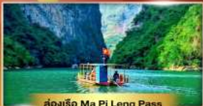
ส่องเรือ Ma Pi Leng Pass

เส้นทางเปิดใหม่ ซาฮาง เช็คอินเมืองตามด้าว "เวียดนามฟีลยุโรป"