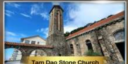
Tam Dao Stone Church