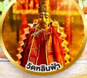
วัดหลินฟ้า ขอพรเสริมโชคกลางในธุรกิจ และการเงิน