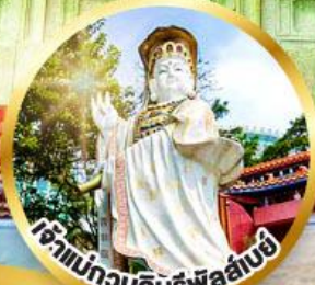
เจ้าแม่กวนอิมรพีผลาลัย ขอพรรับพลังงานดี เสริมพลังดวงจัญ