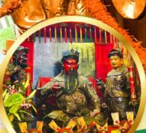
วัดกวนโก ขอพรเทพเจ้ากวนอู เงินทอง, ธุรกิจมั่นคง