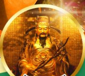
วัดหยวนหยวน ขอพรเรื่องสุขภาพ, โชคลาภ ความสำเร็จก้าวหน้า

เมนูพิเศษ! ต้มช้ำฮ่องกง, บุฟเฟต์ชาบูสไตล์ฮ่องกง, ห่านย่าง