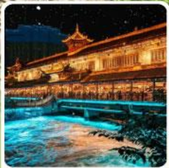
Blue Tears สะพานหนานเจียว