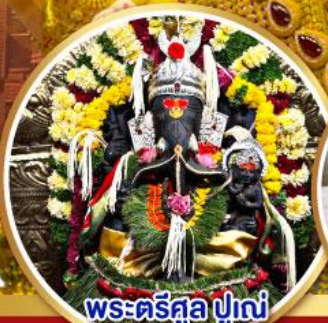
พระตรีศูล ปูणे (Trishul Pune)