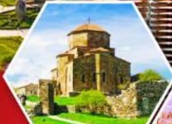
วิหารกอรี