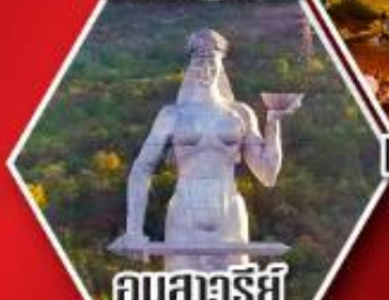
อนุสาวรีย์ มารดาแห่งจอร์เจีย