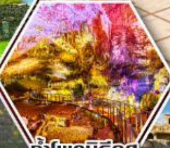
น้ำพุเบริซูล