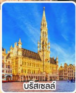
บรีซาซลล์