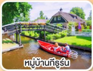
หมู่บ้านทึร์น