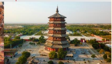
วัดเจดีย์ไม้ มู่ต้า

*ทางบริษัทฯ ขอสงวนสิทธิ์ในการสลับโปรแกรมทัวร์ตามความเหมาะสมขึ้นอยู่กับสถานการณ์หน้างาน โดยคำนึงถึงผลประโยชน์ของลูกค้าเป็นสำคัญ