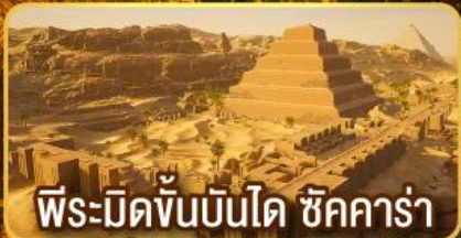
พีระมิดขั้นบันได ชิคคาร์่า