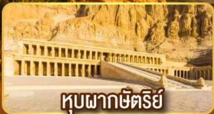
หุบผากษัตริย์