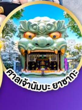
ศาลเจ้ามึมะะ ยาชากะ