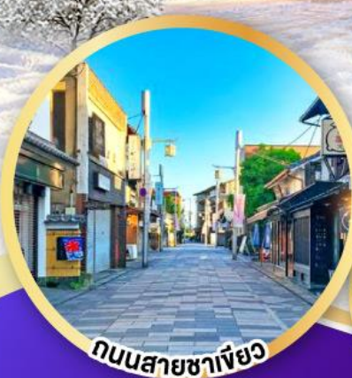
ถนนสายชาเมียว