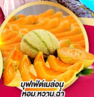
บุฟเฟ่ต์เมล่อน หอมหวานซ่า