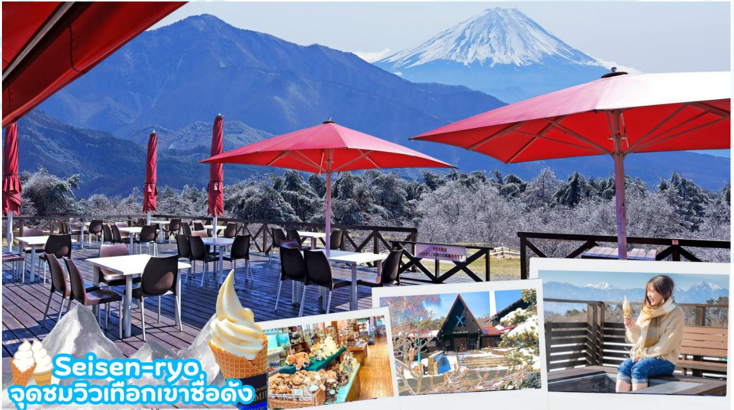
Seisen-ryo จุดชมวิวเทือกเขาฮิดัง

เมืองโฮคุโตะ (Hokuto) ตั้งอยู่ทางตะวันตกเฉียงเหนือของจังหวัดยามานาชิ เป็นเมืองที่ล้อมรอบไปด้วยภูเขาสูง เช่น ภูเขาýtตสึงาตาเกะ เทือกเขาแอลป์ตอนใต้ ภูเขาคินปู และภูเขาคายะงาตาเกะนอกจากนั้นยังสามารถเห็นวิวที่สวยงามของภูเขาไฟฟูจิได้อีกด้วยมีทรัพยากรธรรมชาติที่มีคุณภาพ ไม่ว่าจะเป็นน้ำแร่ เมล็ดข้าว และผลิตภัณฑ์จากนมวัว