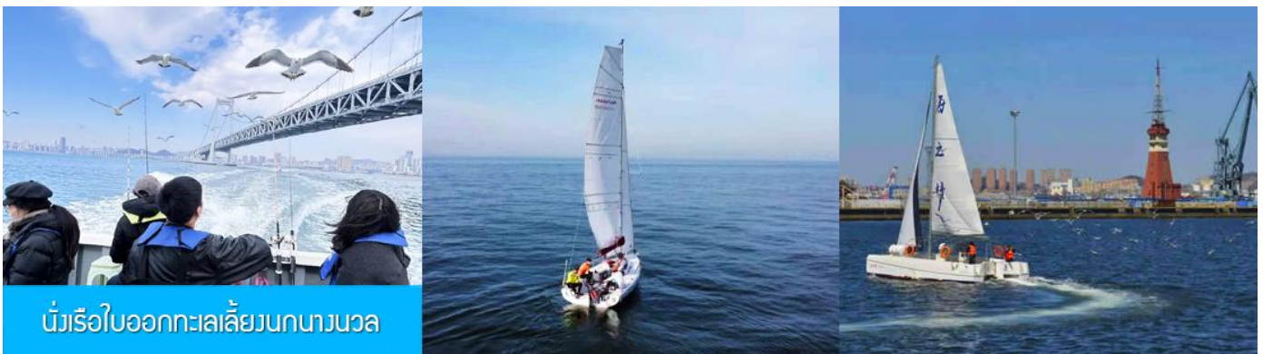
นั่งเรือใบออกทะเลลิ้นกนางนวล