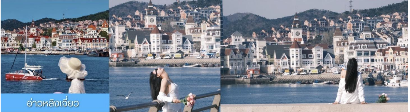
อ่าวหลังเจียว

จากนั้นนำท่าน เที่ยวชม ท่าเรือประมงหู่ทาน 大连渔人码头 เป็นจุดเช็คอินที่โดดเด่นด้วยสถาปัตยกรรมสไตล์ยุโรปสีสันสดใส ผสมผสานกลิ่นอายเมืองท่าดั้งเดิมเข้ากับบรรยากาศสุดโรแมนติคที่เต็มไปด้วยเรือประมง คาเฟ่ ร้านอาหาร และจุดชมวิวยุริมาทะเล