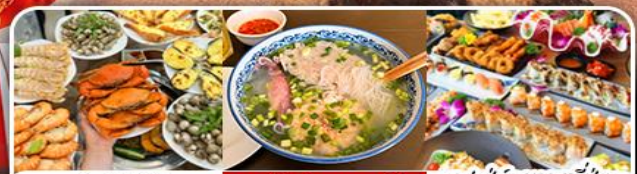
บุฟเฟ่ต์ซีฟู้ด