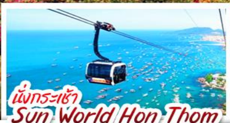
นั่งกระเช้า Sun World Hon Thom