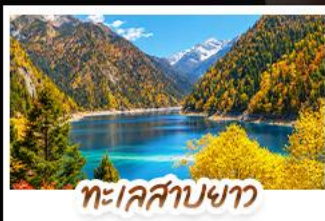
ทะเลสาบชา