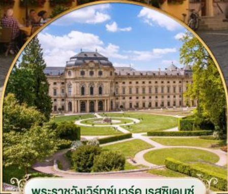
พระราชวังแวร์ซายส์ฝรั่งเศส