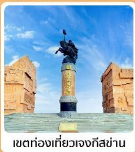
เขตท่องเที่ยวเจงกิสข่าน