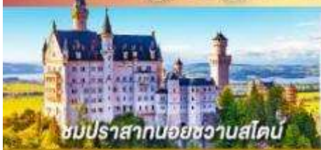
ชมปราสาทน้อยชวานสไตน์