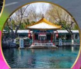
น้ำพุเป่าหู