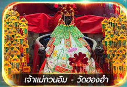
เจ้าแม่กวนอิม - วัดสองอ่า