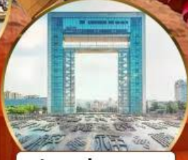
ประตูแห่งความสุข