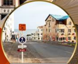
ถนนอ่าวจีป่า