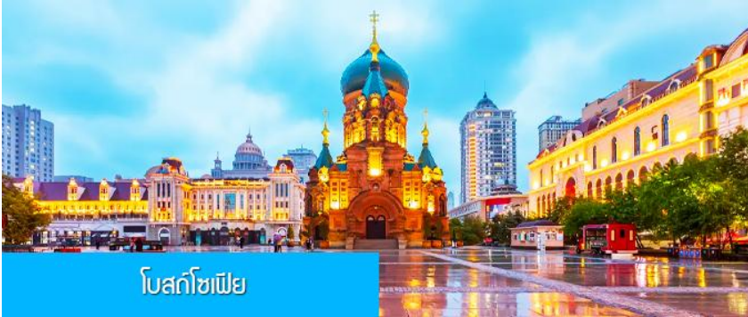
โบสถ์โซเฟีย

รับประทานอาหารเช้า ณ ห้องอาหารของโรงแรม (10)