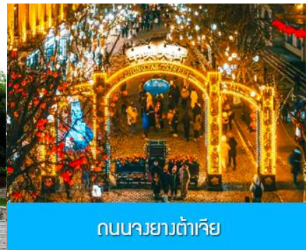
ถนนจงยั้งลู่