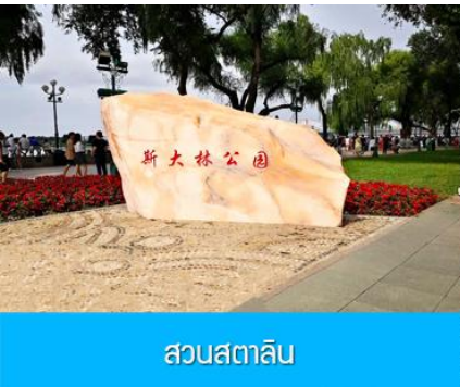
สวนสตาลิน