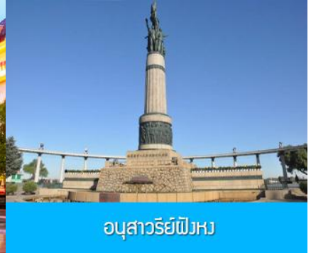
อนุสาวรีย์พิงหว

หลังอาหารนำท่านชม โบสถ์ เซนต์โซเฟีย 索菲亚教堂 (ชมด้านนอก) อีกหนึ่งสัญลักษณ์ที่โดดเด่นของเมืองฮาร์บิน สร้างขึ้นในปี ค.ศ. 1907 เป็น โบสถ์คริสต์นิกายออร์ทอดอกซ์ ที่ใหญ่ที่สุดในเอเชียตะวันออกเฉียง ที่แสดงถึงอิทธิพลของวัฒนธรรมรัสเซียที่มีต่อเมืองฮาร์บิน