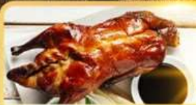
เป็ด Four Season