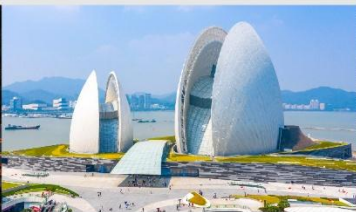
โรงละครหอยไข่มุก