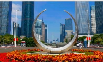
จัตุรัสฮัวเจิง

*ทางบริษัทฯ ขอสงวนสิทธิ์ในการสลับโปรแกรมทัวร์ตามความเหมาะสมขึ้นอยู่กับสถานการณ์หน้างาน โดยคำนึงถึงผลประโยชน์ของลูกค้าเป็นสำคัญ