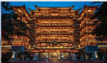
วัดต้าฝอซื่อ