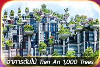
อาคารต้นไม้ Tian An 1,000 Trees