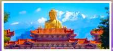
วัดพระใหญ่ทงกวงชาน