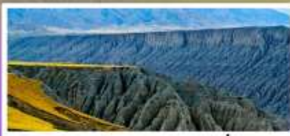
แกรนด์แคนยอนตูซานจื่อ