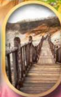
หุบเขาจิกุคาบิ