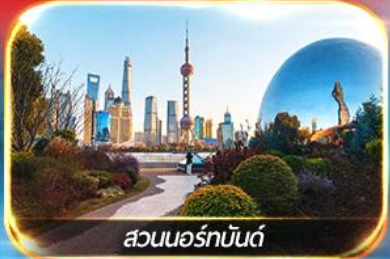
สวนนอร์มันด์