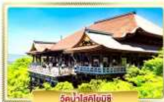
วัดน้ำใสคิโยมิสึ