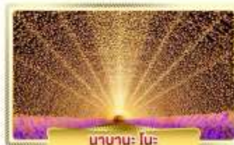
นานานะ โนะ