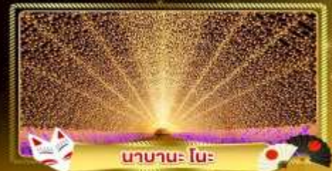
นานาะ โนะ