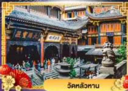
วัดหลิวทาน