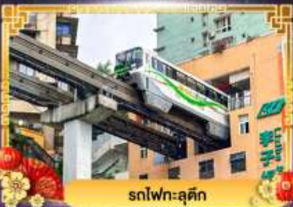
รถไฟฟ้าชุนชิ่ง