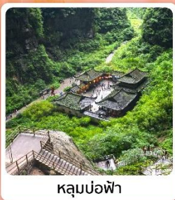
หลุมบ่อฟ้า