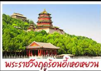
พระราชวังฤดูร้อนอ้าเฮอเฉาหวาน

ท่าอากาศยานปักกิ่ง - พระราชวังฤดูร้อนอ้าหอยวน สวนจิ่งอัน - วัดลามะ - ไม่หลงร้านช้อปปิ้ง - โรงแรม 4 ดาว มือพิเศษ เปิดปีกกึ่ง สุกี้มองโกล MICHELIN GUIDE ร้าน TAO TAO JU