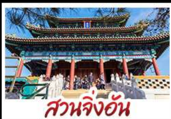
สวนจิ่งอัน