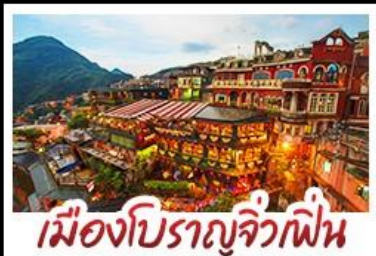
เมืองโบราณจีวเฟิน