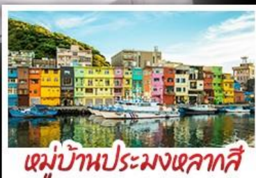
หมู่บ้านประมงเหลกาสี