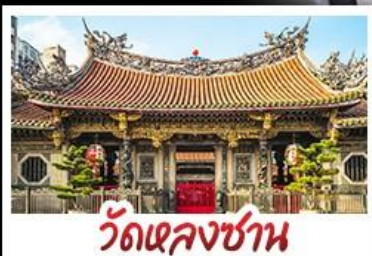
วัดเจหลงซาน