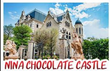
NINA CHOCOLATE CASTLE

ทะเลสาบสุริยจันทรา - ไทเป 101 จิวเฟิน - NINA CHOCOLATE CASTLE MONSTER VILLAGE - ซีเหมินติง เมนูพิเศษ ปลาประจานาธิบดี เซี่ยวหลงเปา / ชาบูไต้หวั่น