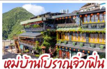
หมู่บ้านปิศาจจิ้งจิก