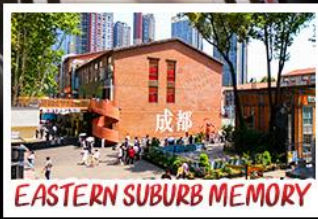
EASTERN SUBURB MEMORY