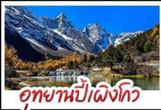
อุทยานปี่เฟิงโกว

อุทยานสี่ดรุณี - อุทยานปี่เฟิงโกว - อุทยานจิวจ้ายโกว รถไฟความเร็วสูง - EASTERN SUBURB MEMORY ถนนโบราณความจำ - วัดต้าฉือ ช้อปปิ้งย่านคัง ถนนไท่กู่หลี่ + ถนนซุนซีลู่