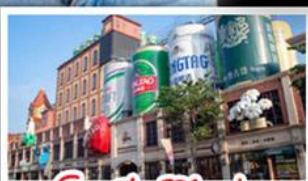
โรงแรมเป่ย์ชิ่งเต่า