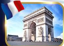
ประตูชัยอาร์กเดอทรียงฟ์