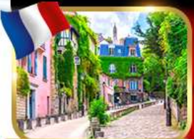
Rue de l'Abreuvoir มงมาร์ต