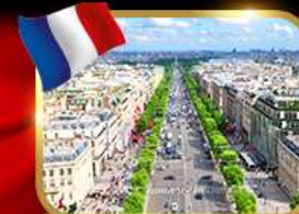
เดินเล่นย่านช็องเซลีเซ่