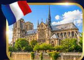
มหาวิหารนอทร์เดอม์