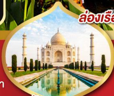
ทัชมาฮาล