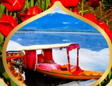
ล่องเรือชิคาร่า