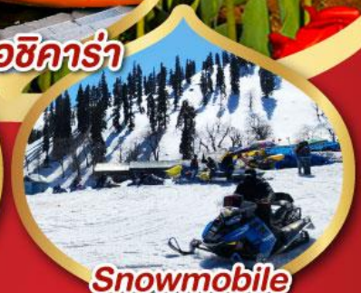
Snowmobile วิวเทากุลมาร์ค ราคาเริ่มต้น