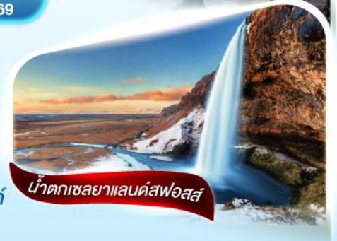
น้ำตกเซลยาแลนด์สฟอสส์