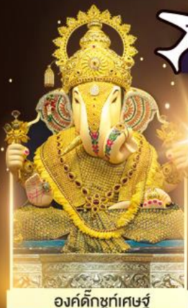
องค์ตั้งบูชท์พิเศษ