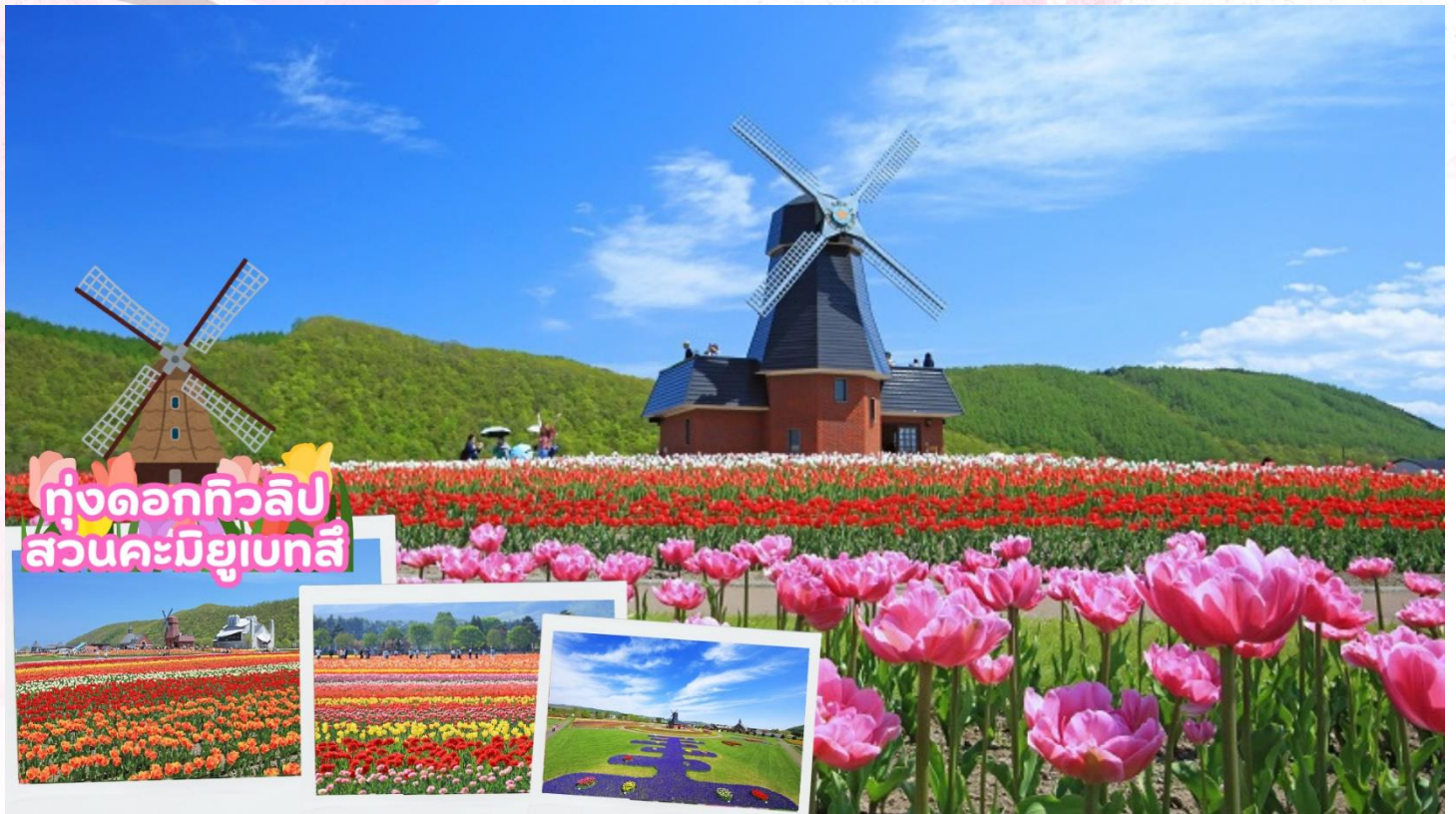
ทุ่งดอกทิวลิป สวนคะมิยูเบทสึ

จากนั้นนำท่านชมทุ่งดอกทิวลิป ณ สวนคะมิยูเบทสึ (Kamiyubetsu Tulip Park) จากสวนดอกไม้เล็ก ๆ ที่ถูกสร้างขึ้นโดยคนท้องถิ่นเพื่อสืบทอดดอกทิวลิป [ดอกไม้ประจำเมือง] ไปสู่รุ่นต่อไป และได้พัฒนา มาเป็นอุทยานทิวลิปคะมิยูเบทสึ ปัจจุบันอุทยานแห่งนี้มีดอกทิวลิปสีแสนสดใส กว่า 1,200,000 ดอก จาก กว่า 120 สายพันธุ์ ที่จะบานทั่วทั้งสวนในฤดูใบไม้ผลิ [ขึ้นอยู่กับสภาพอากาศ]