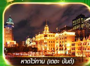
หาดไข่มุก (เดอะ บันด์)

เที่ยวมหานครเซี่ยงไฮ้ ถ่ายรูปเช็กอินที่ Tian An 1000 Trees, ซินเทียนตี้ ช้อปปิ้งตลาดเงินหวงเหมียว, ถนนนานกิง