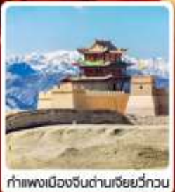
กำแพงเมืองจีนด่านเฉียนชวีกวน

• ไซโล่...เส้นทางสายไหม ชมสระบัววังพระจันทร์ ทะเลทรายหมีงาช้าง กำแพงเมืองจีนด่านสุดท้าย "เฉียนชวีกวน" มรดกโลกภูเขาสายรุ้งจางเย่