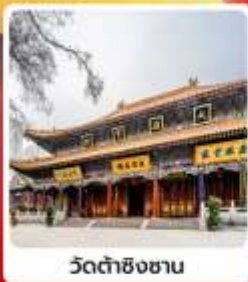
วัดต้าชิงซาน

• โอลิมปิกเกี่ยวข้องชมมรดกโลก สุสานกองทัพทหารจีนซีอองเต๋อ ถ่ายภาพความยิ่งใหญ่ของเจดีย์ห้าชั้นปาใหญ่