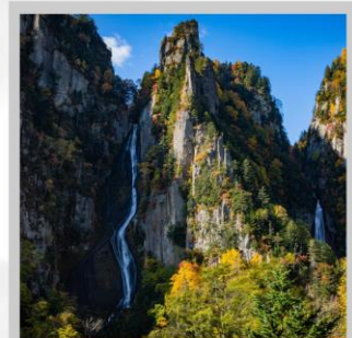
"GINGA & RYUSEI FALLS"

ต้นตอ "ทุ่งดอกพืชมอส ณ สวนดอกชิบะซากุระฮิงะชิโมะโคะโคะ" ด้วยพรมสีชมพูที่มีพื้นที่ขนาดใหญ่ถึง 100,000 ตารางเมตร ชม "ทะเลสาบคาบสมุทรชิเรโตโกะ" เกิดมาจากการระเบิดของภูเขาไฟโอเอและน้ำพุใต้ดิน จนเกิดเป็นทะเลสาบทั้ง 5 ของชิเรโตโกะ "ฟาร์มสุนัขจิ้งจอกฮอกไกโด" ฟาร์มสุนัขจิ้งจอกแห่งเดียวของเกาะฮอกไกโด สายพันธุ์ท้องถิ่นคือ สายพันธุ์ Ezo red fox เพลิดเพลินกับ "เนินสีฤดู" เนินเขากว้างใหญ่ที่มีดอกไม้ไม้บานาพันธุ์นับ 30 ชนิดปลูกเรียงรายสลับสีกันเป็นแนวยาว นำท่าน "นั่งกระเช้าภูเขาคุโรดะเคะ" เชื่อมจากเชิงเขาของเมืองโซอุนเคียวถึงยอดเขาคุโรดะเคะเคะที่มีความสูงถึง 670 เมตร ไฮไลท์ "ส่องเรือราอูสี ชมความงามของวาฬเพชรฆาต" บริเวณคาบสมุทรชิเรโตโกะ มรดกโลกทางธรรมชาติของฮอกไกโด