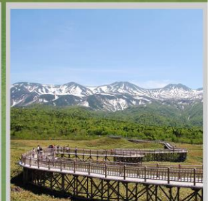
"SHIRETOKO 5 LAKES"