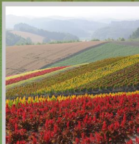
"SHIKISAI NO OKA"