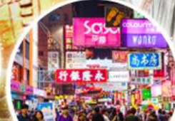
Shopping Taim Sha Tsui