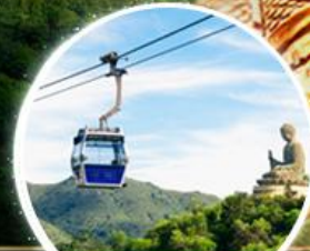
รวมกระเช้าฮ่องกง