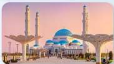
Astana Grand Mosque