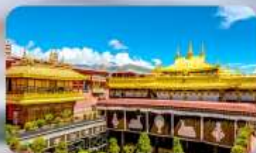
วัดโจกิง