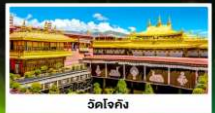
วัดโจกิง