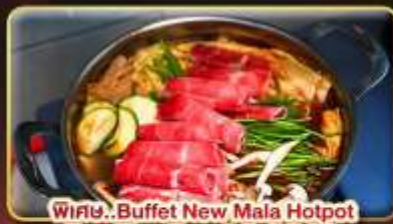
พิเศษ..Buffet New Mala Hotpot Free Flow Beer & Soft Drink