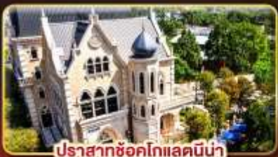
ปราสาทช็อคโกแลตมิน่า

มาแดนดรแห่งเมืองสีกันแห่งไทเป ช้อปปิ้งจุใจ..ตลาดซีเหมินติง ตลาดโตง